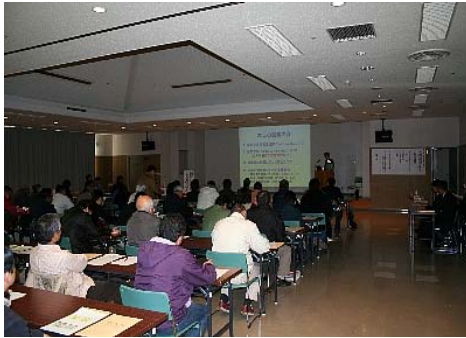
国土交通省の緊急災害対策派遣隊（TEC-FORCE）の活動報告の様子です。

平成22年1月24日（日）に、沼田市保健福祉センターで「砂防公開講座」が開催されました。