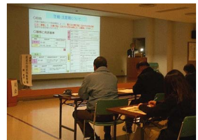
警報や注意報など、防災気象情報に関する講演の様子です。

今回の「砂防公開講座」では、75名の方に聴講していただくことができました。 また、講演終了後には質疑応答が行われ、聴講者の方から多数の質問をいただくなど、地域の皆さんの「防災」に対する意識の高さを感じられました。