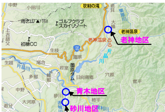
沼田市利根町管内工事施工箇所位置図

現在、沼田市利根町の青木地区及び老神地区、片品村の摺淵地区及び越本地区にて、砂防工事を進めております。なお、第2号では沼田市利根町砂川地区の赤城川における砂川砂防堰堤関連の補強工事、老神地区の片品川における老神床固群の改良工事（一部施工中）が完成いたしましたので、紹介いたします。