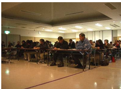
皆さん、熱心に聴講されていました。

今回の講座は、「防災講座」と題して、気象庁が発表する警報・注意報などの気象情報についての解説や国土交通省の緊急災害対策派遣隊（TEC-FORCE）が実際に行った災害支援活動の報告及び群馬県内で地震が発生した場合の被害想定等の解説などが行われ、利根沼田地域やその周辺の地域の方々に災害に対する備えや防災について、考えていただきました。