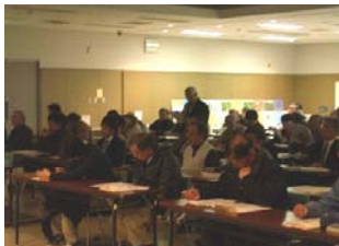
講演終了後、質疑応答を行いました。

※「砂防公開講座」の情報につきましては、利根川水系砂防事務所のホームページで確認することができます。（下記のURLからアクセスできます。）