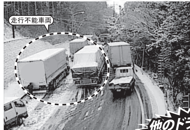
走行不能車両 国道139号(山梨県富士河口湖町)で12月9日に雪による走行不能車両がありました。(冬用タイヤ等の未装着が原因でした。)