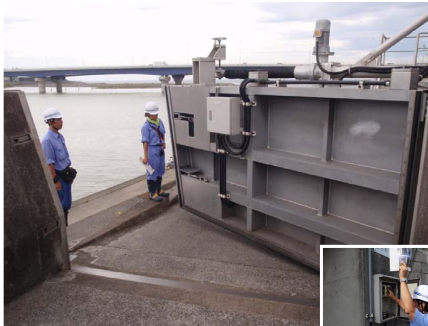
通常時操作(電動方式)

今夏の電力事情を踏まえ、停電時にも確実に施設の操作を行うことを念頭に、手動による施設の操作訓練を実施しました。(相模川 須賀周囲堤陸閘、千石河岸ゲート)