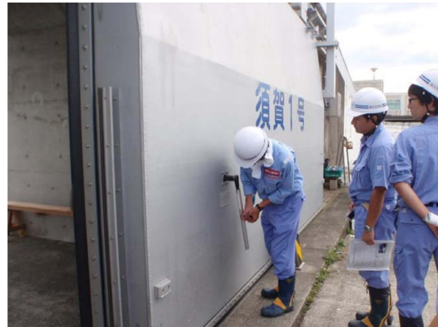
停電時操作(手動方式)