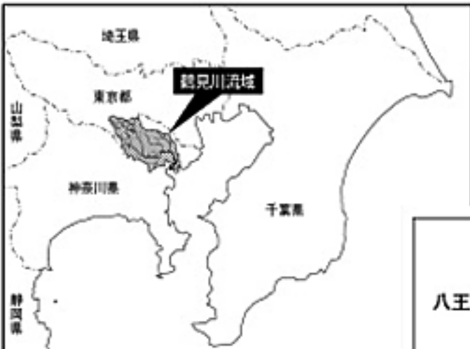
(参考図) 鶴見川水系図