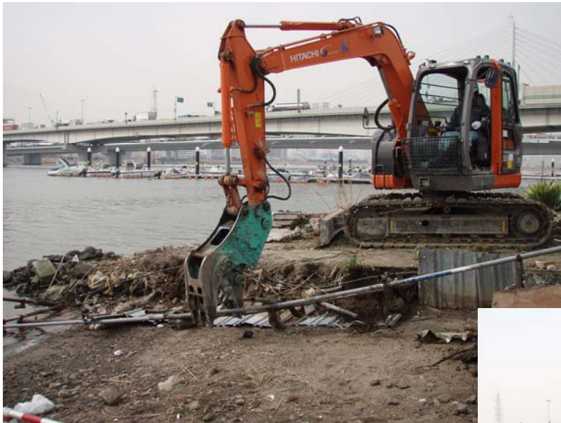
【栈橋解体作業：羽田】