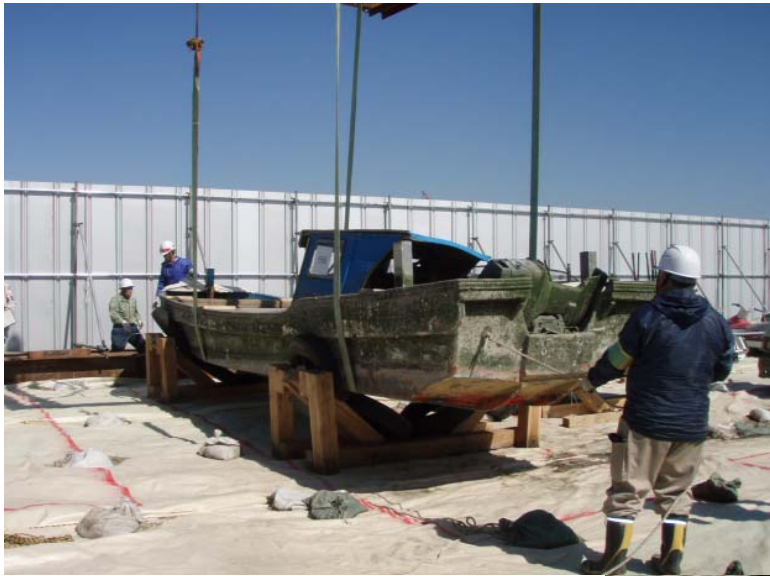
【船舶保管作業：川崎市浮島】