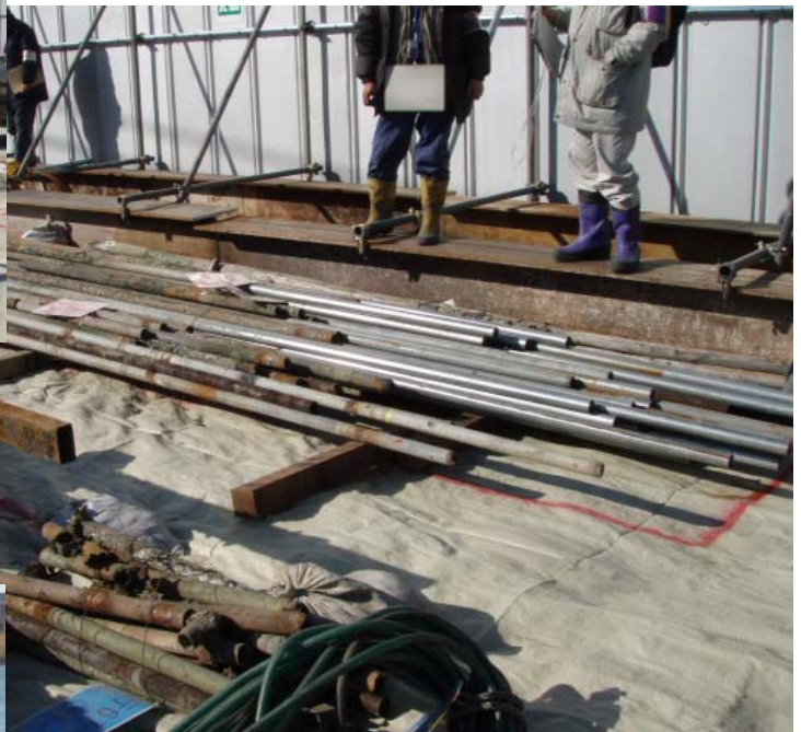
【栈橋保管作業：川崎市浮島】