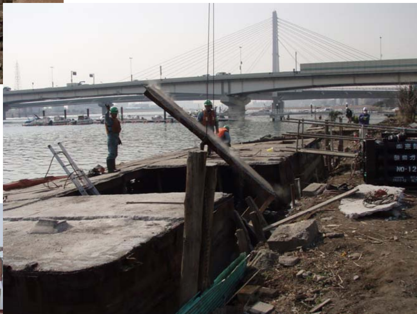
【台船解体作業：羽田】