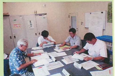
相模川分科会 相模出張所