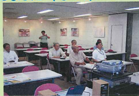
鶴見川合同分科会 鶴見川流域センター