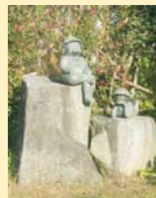
カッパ 多摩川上流の方に生息 (多摩川中央公園)