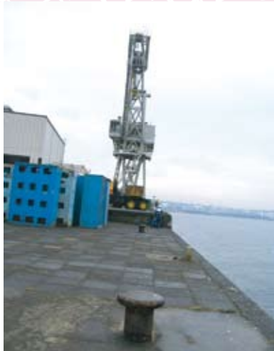
鶴見川河口 クレーン