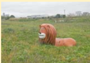
ライオン？ 多摩川遊園 茂みに潜み獲物を狙う