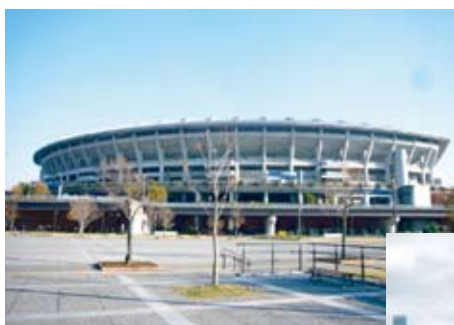
鶴見川遊水地：日産スタジアム等スポーツ施設