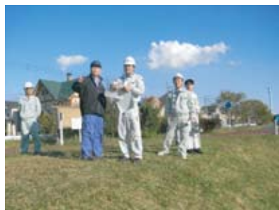
立会の様子 羽村市