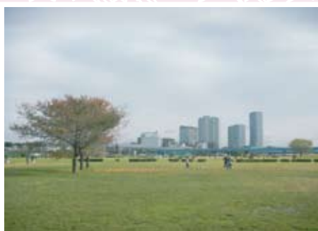
多摩川二子橋公園