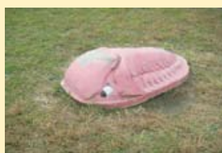
三葉虫？ 二子玉川緑地 頭が禿げている。 何故ピンク色？？