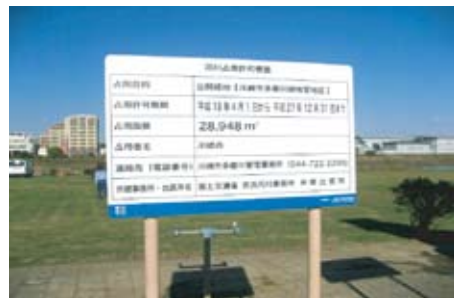
占用許可内容を示す標識板

洪水のときに水の流れを妨げるなど、水害の原因となることの無いように現地で立ち会い占有許可条件等が守られているか確認しました。