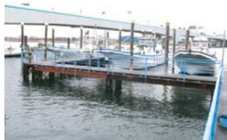
多摩川河口付近 船舶係留施設