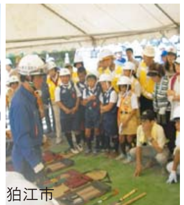
狛江市 災害時の道具の使い方