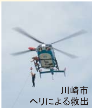
川崎市 ヘリによる救出