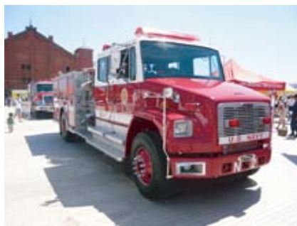
横浜フェア：米海軍の消防車 コカコーラみたいな塗り分け？