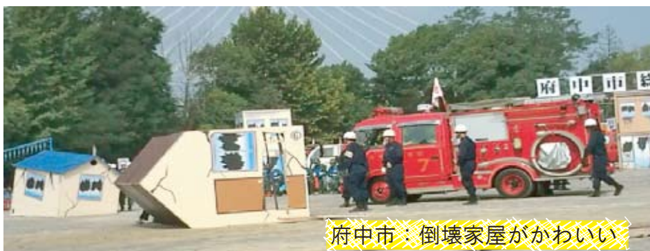
府中市：倒壊家屋がかわいい