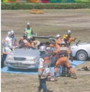
座間市：車から救出