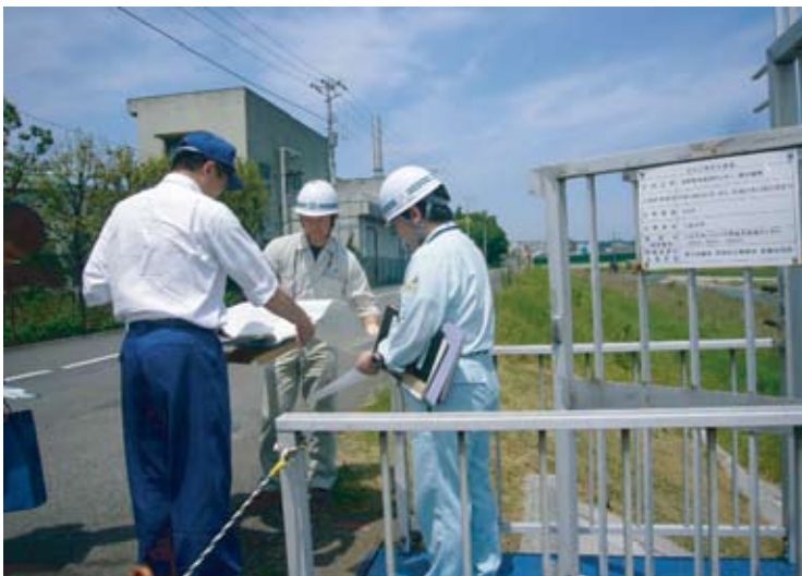
書類を確認します。