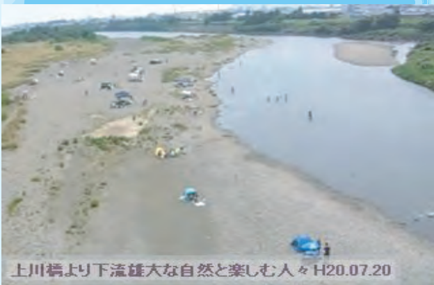
上川橋より下流雄大な自然と楽しむ人々 H20.07.20