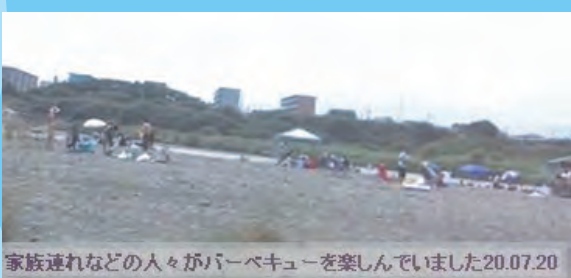
家族連れなどの人々がバーベキューを楽しんでいました 20.07.20