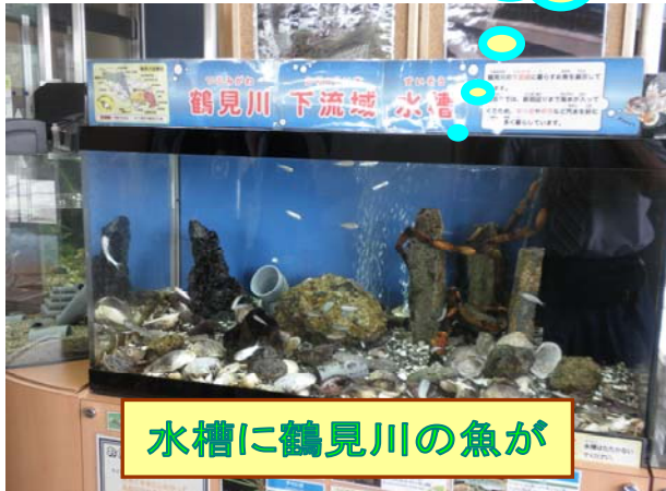
水槽に鶴見川の魚が