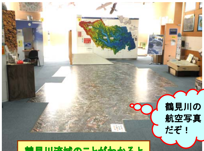
鶴見川流域のことがわかるよ