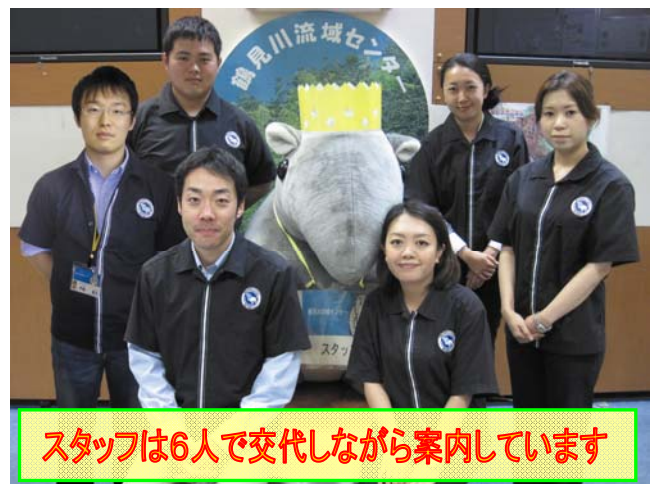
スタッフは6人で交代しながら案内しています