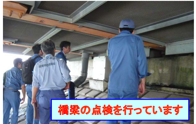
橋梁の点検を行っています