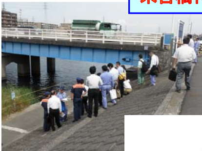
末吉橋付近で現場確認