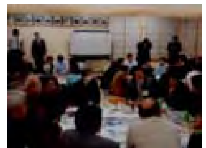
グループ作業の様子