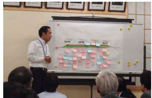
【グループ作業の発表】