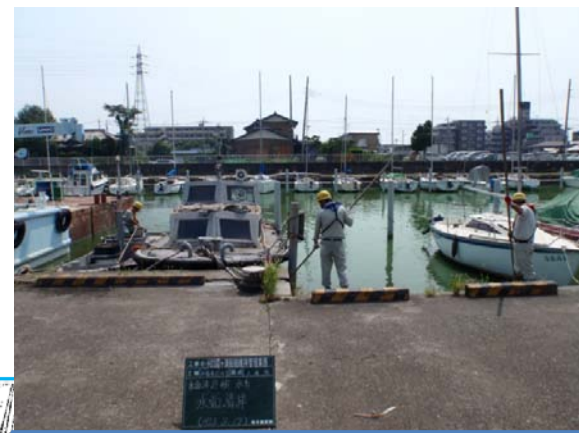
8/17土浦港 腐敗したアオコ攪拌作業