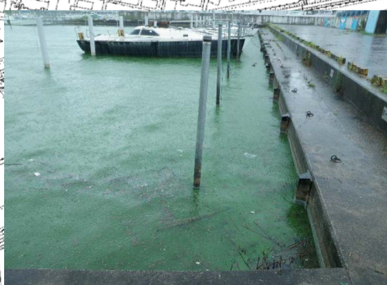
8/19 土浦港 アオコ無し