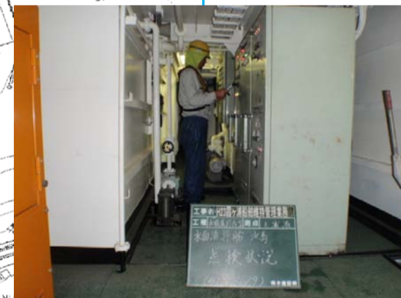
8/19 現場待機 水面清掃船「水馬」の点検 (アオコが無くなった為)