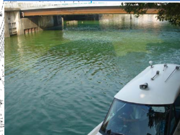
8/17新川 巡視船「かすみ」による攪拌作業