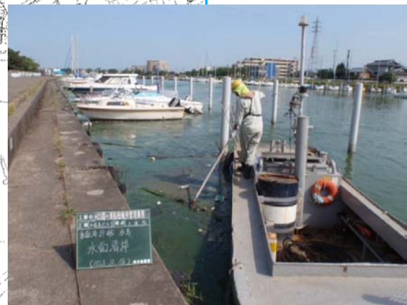
8/18 腐敗したアオコ攪拌作業