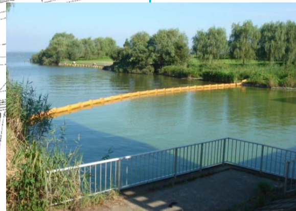
備前川のアオコフェンス状況