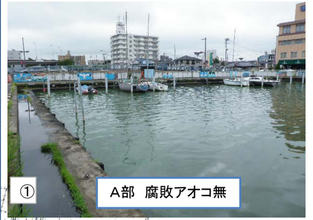
① A部 腐敗アオコ無