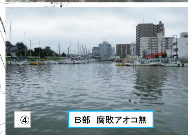
④ B部 腐敗アオコ無