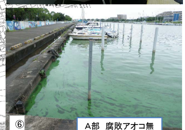
⑥ A部 腐敗アオコ無