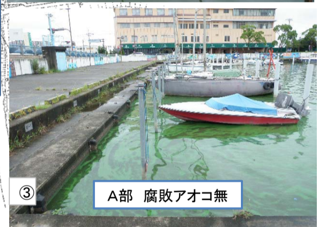
③ A部 腐敗アオコ無