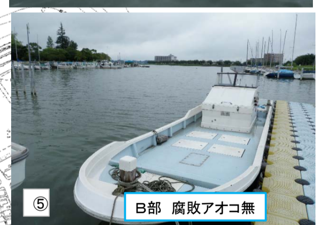
⑤ B部 腐敗アオコ無