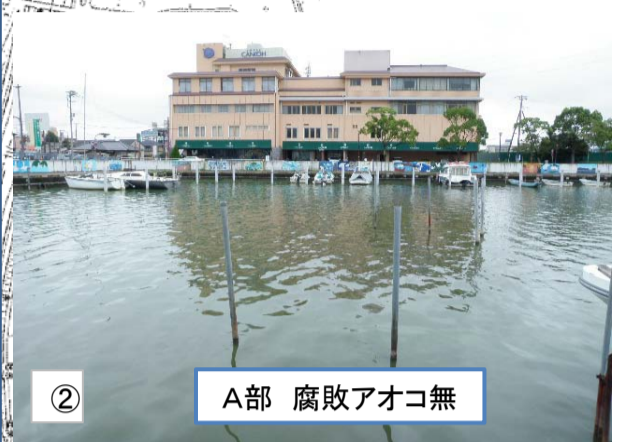
② A部 腐敗アオコ無