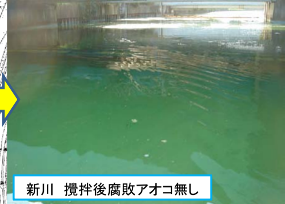
新川 攪拌後腐敗アオコ無し