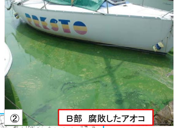
② B部 腐敗したアオコ