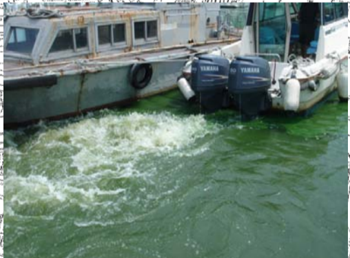
巡視船「かすみ」による攪拌