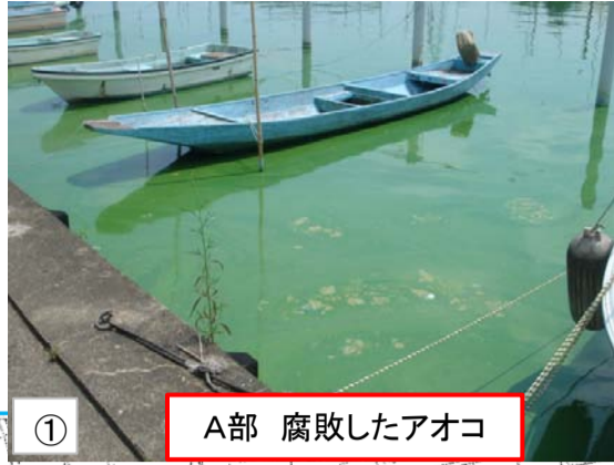
① A部 腐敗したアオコ