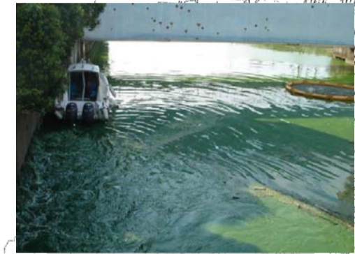
巡視船「かすみ」による攪拌