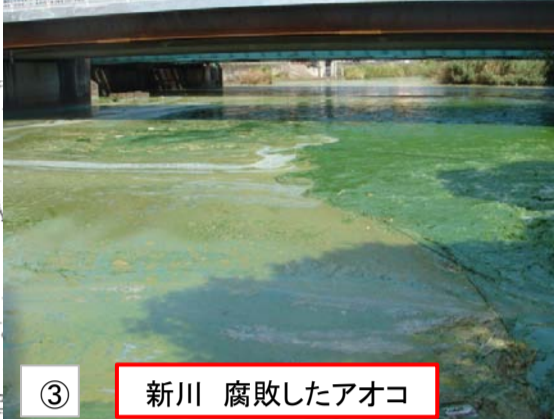
③ 新川 腐敗したアオコ