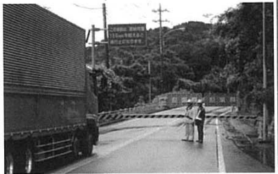
【古屋敷】通行規制状況

〈事前通行規制区間について〉 台風などの大雨の際にあらかじめ定めた規制雨量※に達すると、道路利用者の安全を確保するため通行止めを行う区間です。 ※通行止めを行う降雨量の基準のことであり、規制区間ごとに、連続雨量(降り始めからの雨量を合計し高さで表したもの)で定めています。