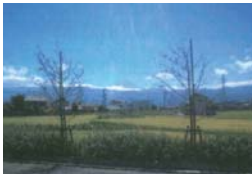
玉簾公園(Kai・遊・パーク)及びアルプス通り