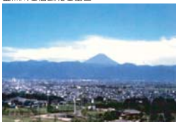
赤坂総合公園（ドラゴンパーク）展望塔からの富士