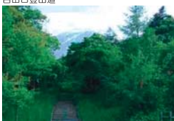
馬返（吉田口登山道）