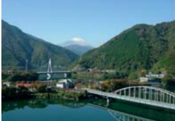
丹沢湖畔千代の沢園地展望台