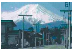
上吉田 御師のまち