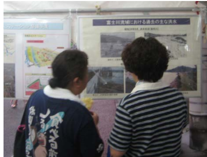
●過去の災害パネル

過去の災害、増穂地区防災ステーションなどのパネル展示及び説明を行い、河川事業の必要性を広報いたしました。