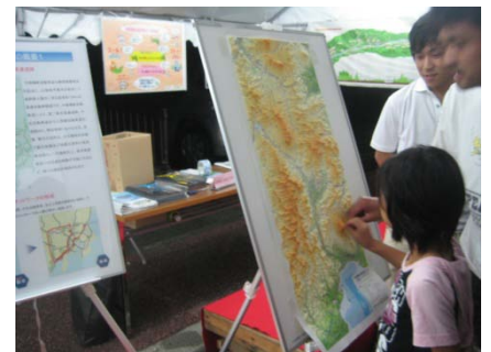
●立体地図でルートを説明