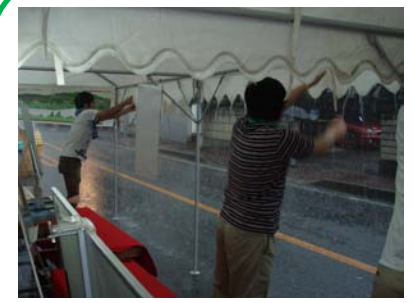
●前半は大雨で大変でした