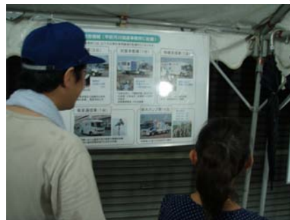
●災害対策機械の説明

東日本大震災等における当事務所の支援状況や、災害対策支援車(照明車、ポンプ車等)のパネル展示及び説明を行い、災害支援の取り組みを広報いたしました。