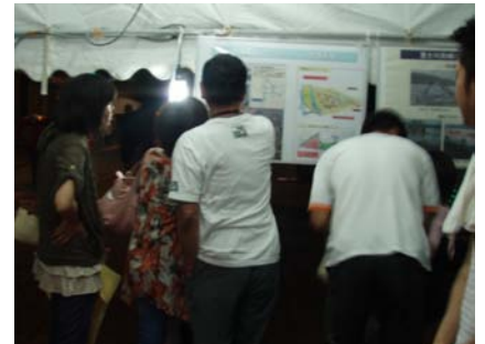
●増穂地区防災ステーションの説明