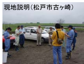
現地説明(松戸市古ヶ崎)

合同巡視は、出水時に水防活動を行う水防団の方と松戸市・流山市・千葉県と共に、事前に水防上重要な箇所を現地において確認するものです。