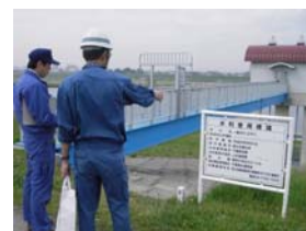
樋管検査(野菊の里浄水場)