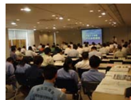
1都3県3区14市3町の関係者が集合!

江戸川水防部会は、江戸川の水防に関わる関係者が一堂に会し、今年度の重要水防箇所の確認や情報の伝達系統の確認などを行います。