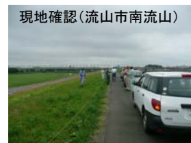
現地確認(流山市南流山)