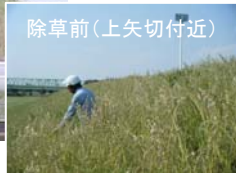
除草前(上矢切付近)