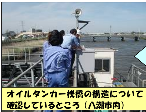
オイルタンカー棧橋の構造について 確認しているところ(八潮市内)