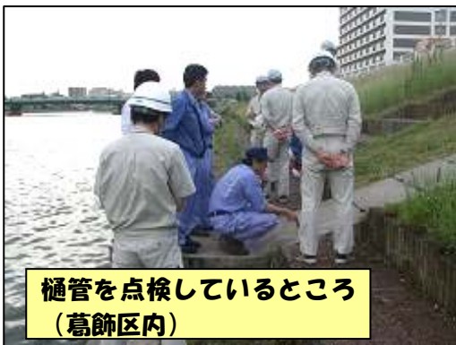
樋管を点検しているところ (葛飾区内)

履行検査とは、河川区域内に許可を受け設置している工作物「許可工作物(橋梁、樋門、その他施設等)」に対し、適正な状態に維持管理されているかを出水期の前に確認する検査です。