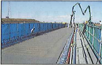
橋桁を作るためにコンクリートをポンプ車で打設しています。