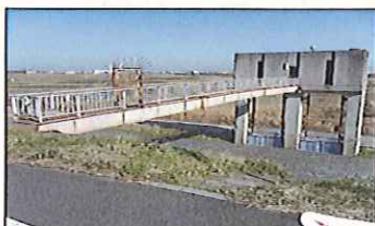
工事をする前の状況です。