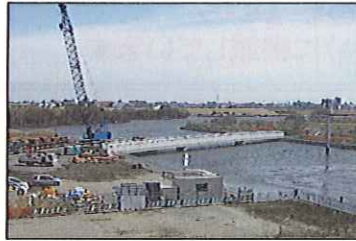
橋桁が完成した後に仮設資材等をクレーンで移動しています。