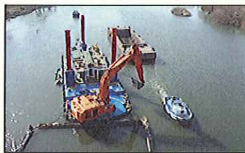
浚渫した土砂は土運搬船に乗せて水上運搬します。