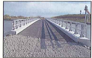
橋梁の完成です。緊急時に物資輸送等で活用されます。