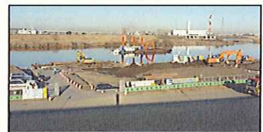
水上運搬した土砂は岸壁から陸に揚げて仮置きした後、築堤等に使用する予定です。