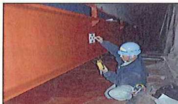
何回にも分けて塗装します。写真は塗ったペンキの厚みを検査しています。