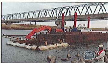
バックホウが搭載されている船に川が濁らないように枠を付けて浚渫を行います。