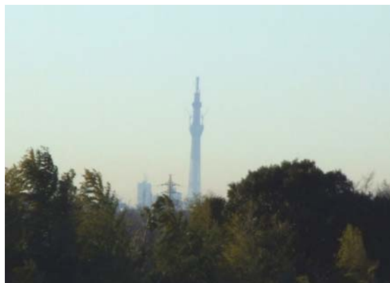
排水機場屋上から

東京スカイツリーが550mを超えました。首都圏外郭放水路庄和排水機場からの見晴らしは非常に素晴らしいことから、東京スカイツリーの様子を見ることが出来ます。また、江戸川の堤防を約3km上流に行くとスカイツリーと庄和排水機場を並んで見ることが出来ます。