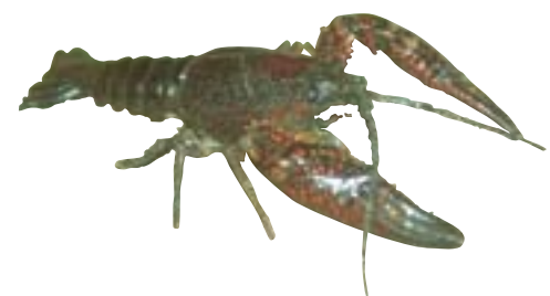
アメリカザリガニ

大きさは10cmぐらいで、流れがゆるやかで浅い泥の多い川底にすんでいる。北アメリカから入ってきた外来種。 ●まちがえやすい生物 北海道や東北地方などには、きれいな水にすむもともと日本にいた別種類のザリガニがいる。