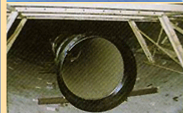
地下鉄内に設置された導水管