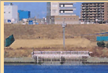
荒川取水口浄化機場