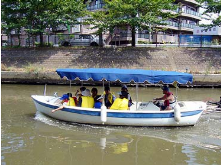
■ エコボートに乗って草加の松並木を川から眺める。