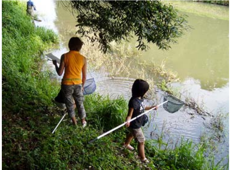
■ 馬込河畔林で網を使って生き物をチェック。