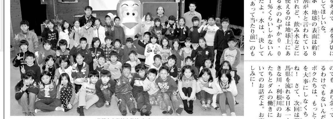
前橋市立岩神小学校4年生のみなさん