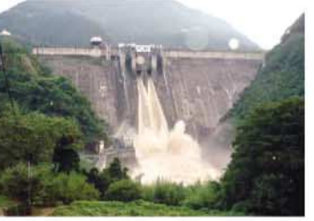
貯めておいた水を放流している下久保ダム

ダム管理所では、大雨の影響による土砂崩れなどで、道路が通行不能となる孤立した状態や、停電などによる悪条件に見舞われながらも、職員全員が徹夜でダム操作をしたんだ。ダムで働く人たちの一所懸命な努力によって、洪水被害からみんなのまちを守る働きをダムはしているんだよ。感謝しなければいけないね。