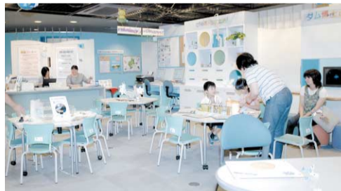
クイズやゲームをしながら学べる館内

映像と音でダムや水のことやわかる「ダムシアター」のメニューも充実。利根川の豆知識を紹介したものの、アニメーションを使ってポトムが説明してくれるもの、ダムの放流状況など全部で19本。好きなメニューのボタンを押すと館内が自動的に暗くなって上映が始まるよ。鳥のように空から地上を見下ろすような衛星写真の映像もあつて見応え十分! ギャラリーや図書・ビデオコーナーも広く使えやすくなった。資料は、貸し出しもしているから家に持ち帰ってじっくり読んだり見たりもできる。新しくなった「ダム資料館」。ぜひ、みんな遊びに来てね!