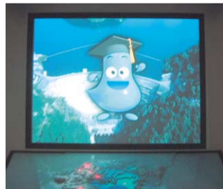
19本も映像があるシアター