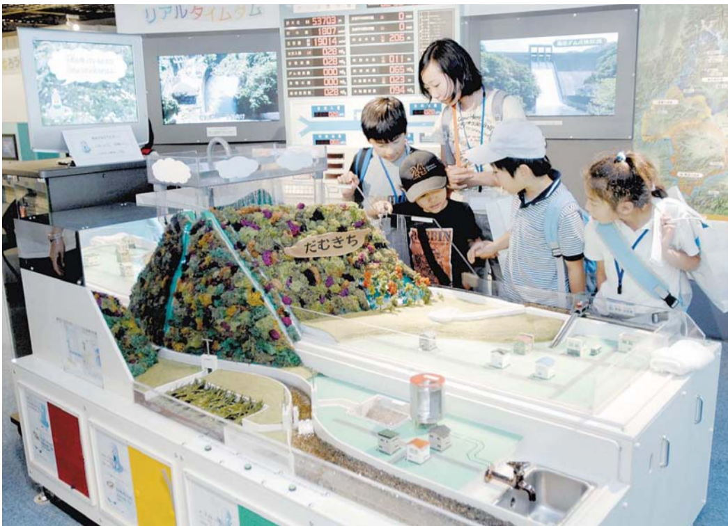
治水と利水が学べるようになった「だむきち」

「だむきち」のとなりにあるのは、実際にみなかみ町の相模ダムで使われていた「ダムコン」。洪水調節のためにゲートを作動する機械なんだ。実際に動かすことはできないけれど、ダム操作の雰囲気味わえることで人気を呼んでいる。その左側には画面があって、利根川ダム統合管理事務所管理するダムやその周辺の映像をリアルタイムで見ることが出来る。今回のリニューアルで、タッチパネルを追加。藤原・相模・團原ダムの中から好きな場所を選んで見られるようになったんだ。現場の天気やダムの水の量のほか、運がよければ放流のようすなんかも見られるかも!