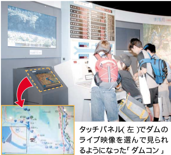
タッチパネル(左)でダムのライブ映像を選んで見られるようになった「ダムコン」

夏休み特別イベント開催中! 「水に親しむ科学実験をしよう!」水の「圧力」と「浮力」について、おもしろい実験をしながら学べるよ。また、発泡スチロールを使って舟を作る工作もできるぞ。夏休みの自由研究に利用してね!