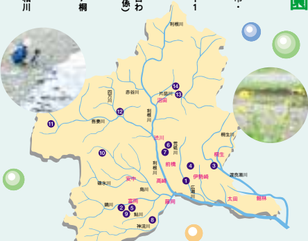
ここで紹介した親水公園・親水施設は「上毛新聞」の川の子の読者募集部の取材・運営でできました。このほかにもあります。紙面の都合上紹介できませんでした。