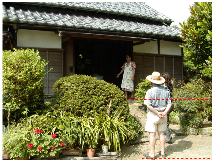
水屋の敷高は、手前の地面よりも一段と高くなっている。

とくに蔵は収穫物や貴重品などを保管する場所として重要で、水屋と呼ばれた。このほかに、納屋の軒先に舟を吊るしておいたり、馬塚を設けたりして非常の時に備えたという。