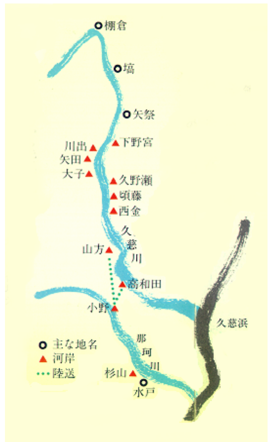
図 2-6 久慈川の舟運と河岸