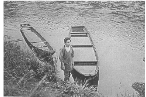
こころふじ 頃藤の渡し跡(大子町)