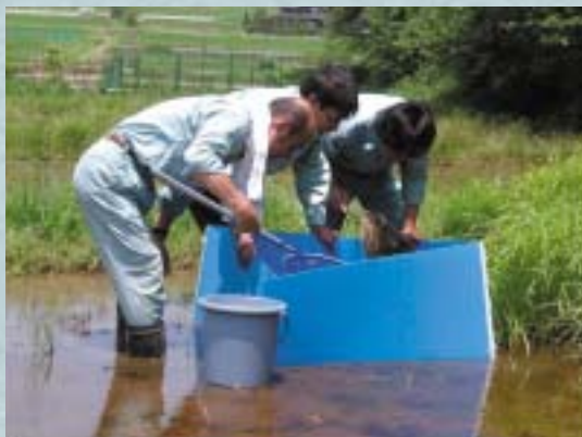
生物等のモニタリング