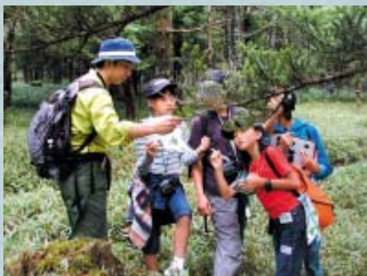
自然環境学習の様子