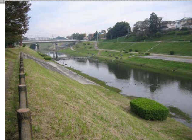
運河橋・運河水辺公園付近の様子