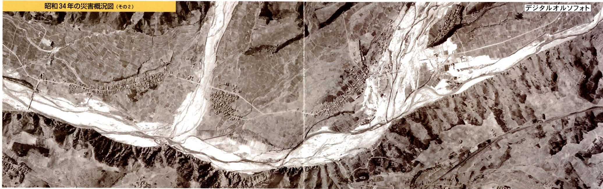
デジタルオルソフォト