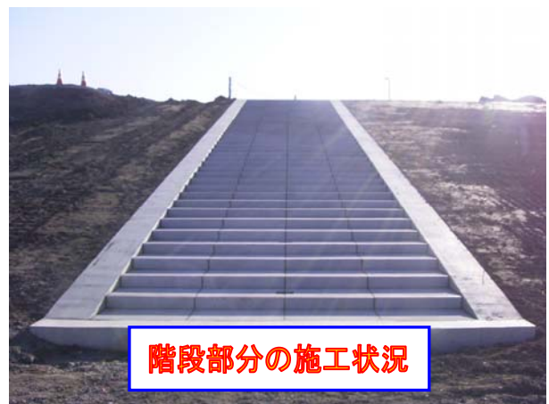
階段部分の施工状況