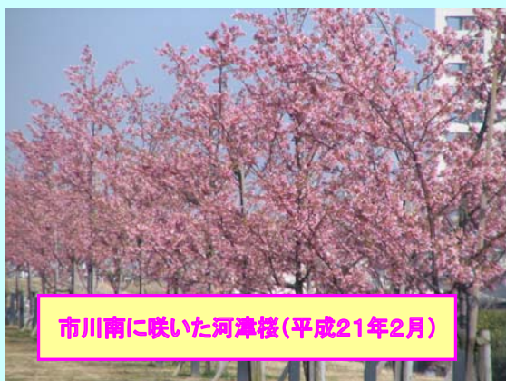
市川南に咲いた河津桜(平成21年2月)

市川市の江戸川桜並木(妙典スーパー堤防、市川南地先)では、早咲きの「河津桜」が2月中旬にきれいに咲いていました。