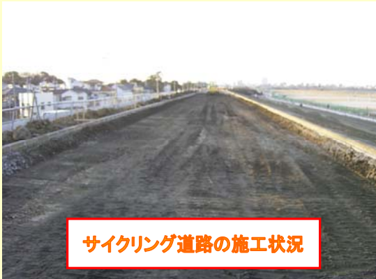
サイクリング道路の施工状況

江戸川区内では、江戸川に面して約6kmの内半分にあたる約3kmの堤防拡幅工事を行っています。今回の工事は、堤防を補強し洪水の被害を減らすことが目的ですが、日常的に利用されている皆さんには、次のようなメリットがあります。