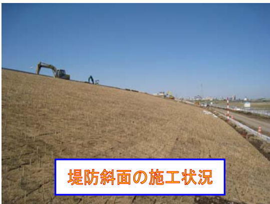
堤防斜面の施工状況

最近、雨の日が多く場合によっては、休日も工事を行っています。3月末までご迷惑をおかけしますが、ご協力をお願い致します。