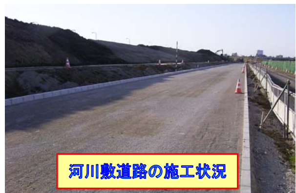
河川敷道路の施工状況