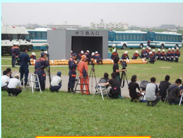
警視庁総合警備訓練