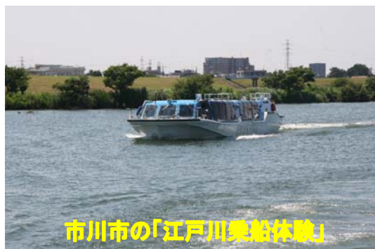
市川市の「江戸川乗船体験」