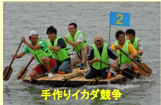
手作りイカダ競争

Eポートレースや手作りイカダ競争、キッズボート、うなぎのつかみ取りや売店等さまざまな催し物が行われました。