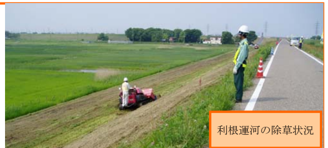
利根運河の除草状況

現在、1回目の除草が終わり、6月の中頃から2回目の除草工事を行う予定にしています。近隣の皆様や通行者の方々には大変ご迷惑をお掛け致しますが、ご協力の程宜しくお願い致します。