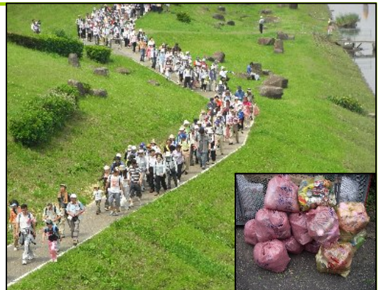
利根運河ウォークの風景(上)と回収ゴミ(右中)