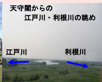
天守閣からの 江戸川・利根川の眺め