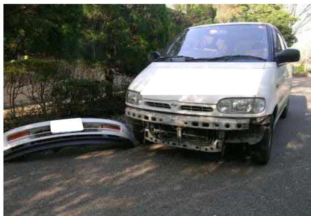
貸与車両損傷状況