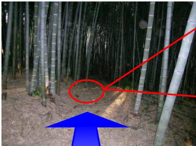
貸与車両にて進入