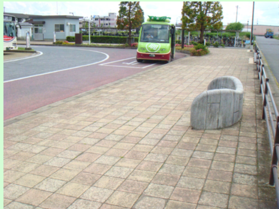
↑バス停上屋のない現在のコミュニティバス乗り場

関宿地区唯一の公共交通機関であるバスの発着地となる「関宿中央ターミナル」のコミュニティバス停留所に屋根(上屋)を設置！