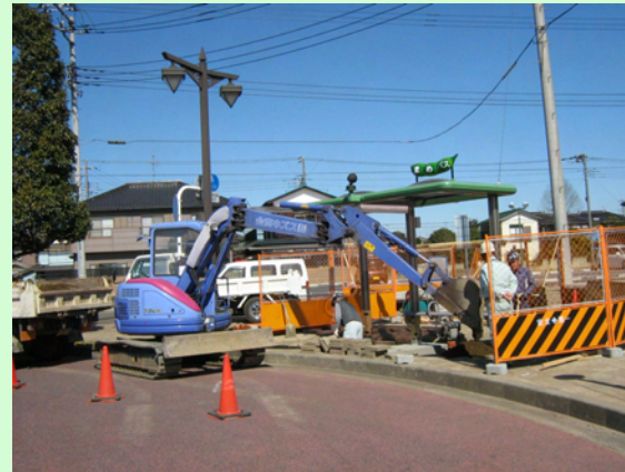
↑バス停上屋整備中の状況と上屋のデザインイメージ