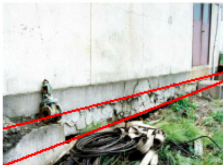
埼玉県鷲宮市(1994年撮影)