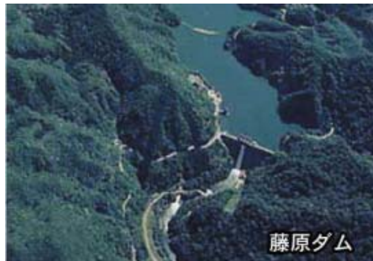
管理開始から47年となる藤原ダム