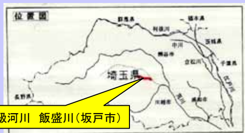
一級河川 飯盛川(坂戸市)