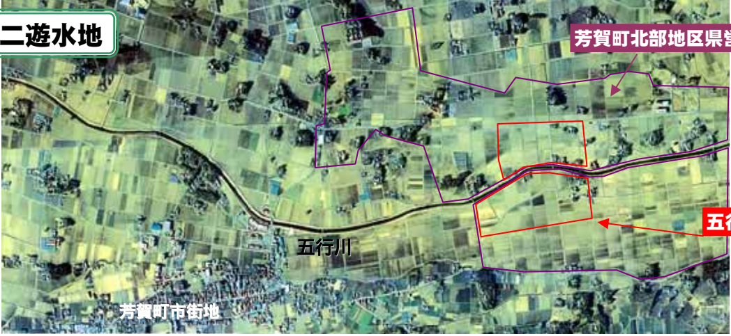
五行川第二遊水地