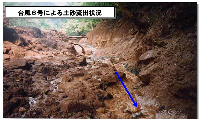
溪流内に多量の不安定土砂が堆積