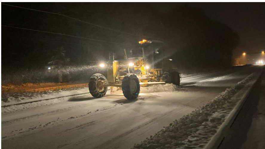
(令和7年3月 国道139号 山梨県南都留郡鳴沢村)