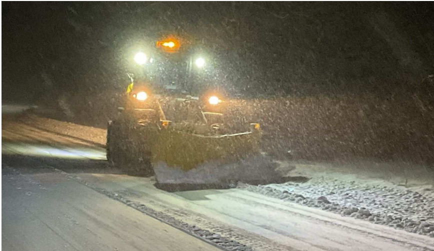
(令和7年3月 国道139号山梨県南都留郡鳴沢村)