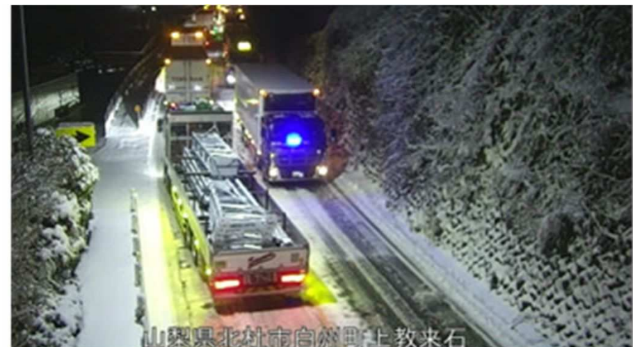
(令和7年3月 国道20号 山梨県北杜市)