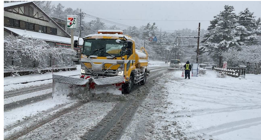
(令和7年2月 国道138号 山梨県南都留郡山中湖村)