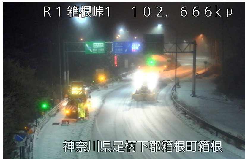
神奈川県足柄下郡箱根町箱根 (令和6年2月5日 国道1号 箱根町)