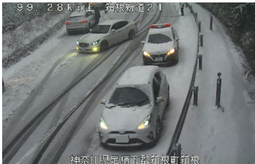
神奈川県足柄下郡箱根町箱根 (令和6年2月25日 国道1号 箱根町)