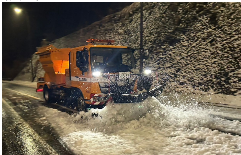
(令和7年3月5日 国道1号 箱根町)