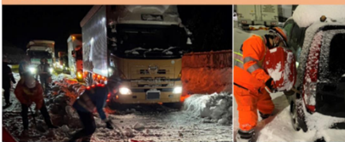
自力走行不能車両とならないよう、冬道の備えをお願いします。

2023年1月にE1A新名神で大規模な滞留車両が発生し、長時間にわたる通行止めとなりました。