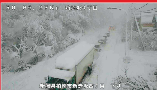
令和4年12月19日 国道8号(登坂不能車による交通障害の発生状況)